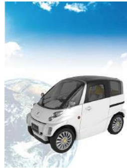
世界最小の4人乗り電気自動車 「FOMM コンセプト One」

本大会を通じ、VEを活用して復活を果たした企業の奮闘ぶりに感銘を受け、行政やサービス産業への広がりを感じ、インドをはじめとする海外企業の取り組みから刺激をもらえるはずです。ぜひ、VEによって意識改革を進め、創造的な問題解決をはかっている企業の運営ノウハウから多くのことを吸収してください。