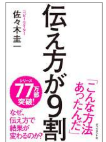
「伝え方のレシピ」を紹介する ベストセラービジネス書