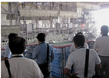
格納庫見学の様子