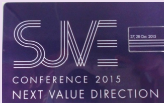
第48回VE全国大会資料集 (USB)