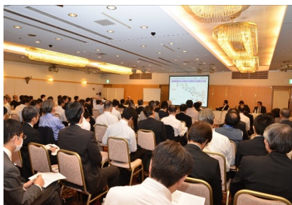
VE推進者向けセッション

表彰式の後、競争戦略の第一人者である一橋大学大学院の楠木建氏による基調講演、マイルズ賞およびVE活動優秀賞の受賞報告、SAPジャパン馬場渉氏によるビッグデータ活用に関する講演、80万部のベス