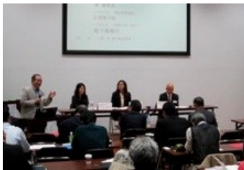
パネル討論の様子