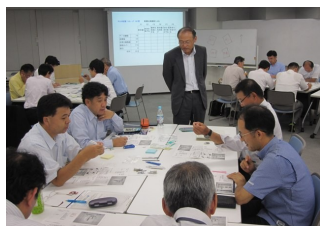
グループ演習の一コマ

9月17日、西日本支部(東海地区)では定例のVE技術情報交流会を名古屋市内で開催しました。