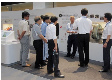
エンジン整備について 説明を受ける参加メンバー