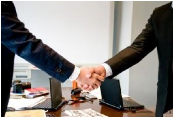
信頼と実績の日本VE協会が全面サポート