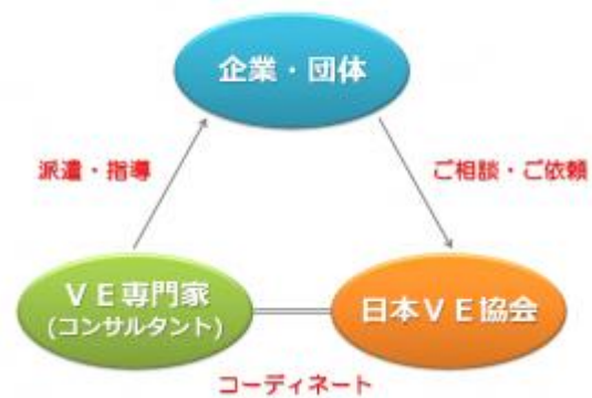
バリュー・ソリューション・サービスのイメージ