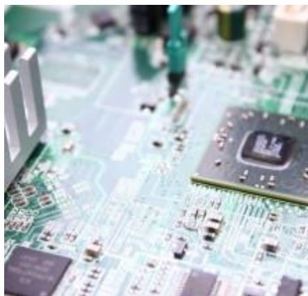
エレクトロニクス分野