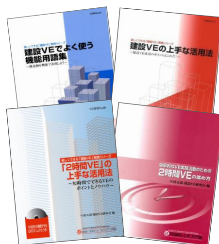
これまでに発行した研究報告書