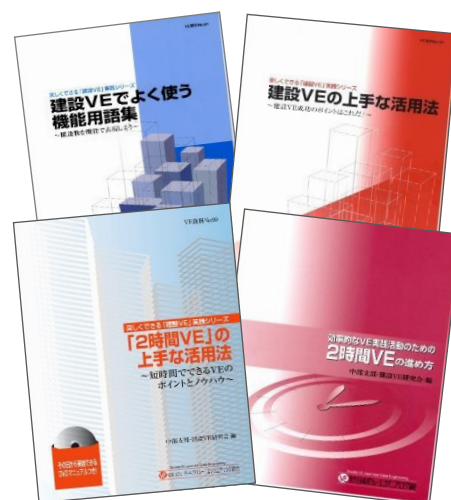
これまでに発行した研究報告書