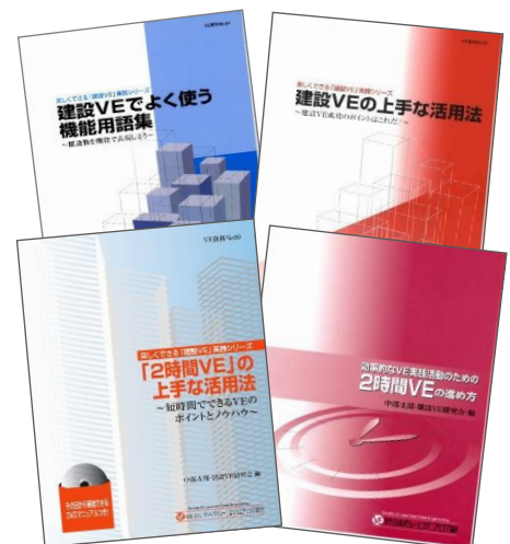
これまでに発行した研究報告書