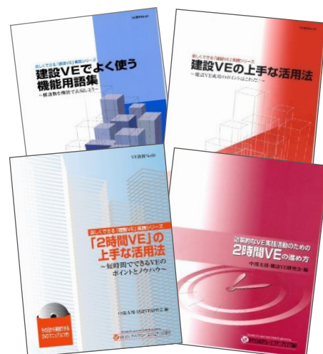
これまでに発行した研究報告書