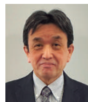
株式会社HYSエンジニアリングサービス 企画部

当社は製品設計・製造、製品の保守・サービス、業務サービス等多様な業態のため、顧客の要求するモノ・サービスや、これらの利益を改善するための手段も様々です。VEL取得者を増やすことで、多様な業態でもVEの考え方や手法をベースに価値向上を考えることができます。また社内の業務改善にも生かすことができ、効率化推進に役立つことから、全体の底上げが図れております。